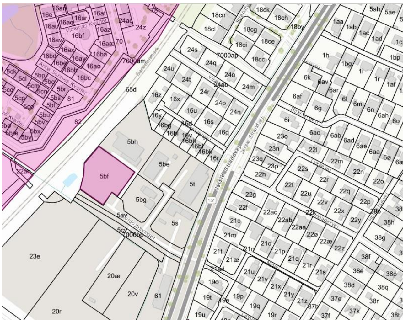
Fig. 1. Udtalelses område markeret som lyslilla figur, matr. 5bf.