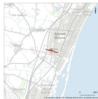
Projektets placering i kommunen