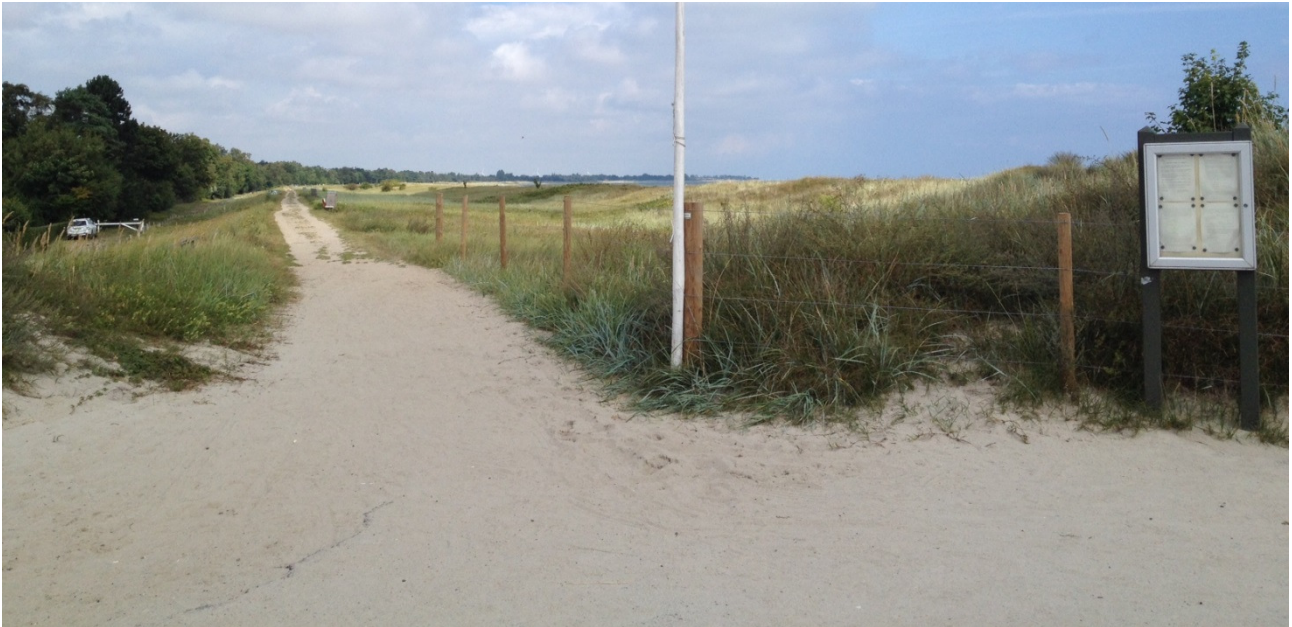
Det Falsterske Dige med klitrækken på ydersiden.