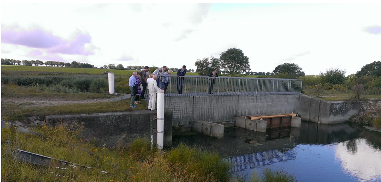
Slusen ved udløbet af Tryggevælde Å

Udløbet fra Tryggevælde Å blev besøgt, idet der i udløbet er etableret en højvandssluse. Størrelsen på vandløbene i Solrød er betydelig mindre end Tryggevælde Å, sluser i Solrød vil derfor også fylde langt mindre.